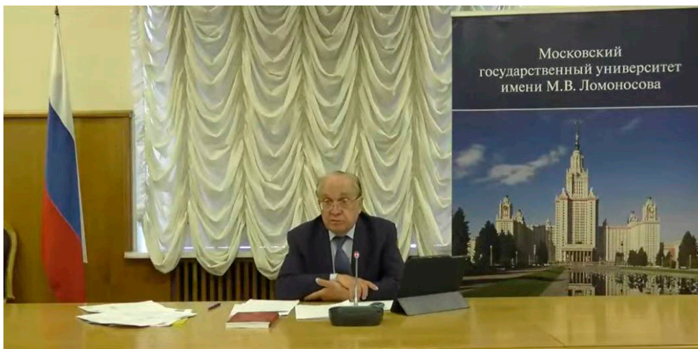
Пленарное заседание. Доклад ректора Московского университета академика В.А. Садовниченко

Пленарное заседание открылось докладом ректора Московского университета академика Виктора Антоновича Садовниченко, в котором была задана, условно говоря, пространственно-временная координата всей конференции, поскольку речь шла в том числе и об истории проведения Дней славистики в стенах Московского университета, и о судьбах ученых-филологов – участников Великой Отечественной войны, и о том, как сегодня Московский университет празднует 75-летие Победы.